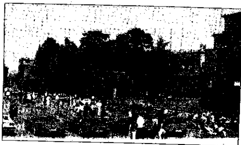
Le Ferrari in mostra sulla piazza Baracca

Una manifestazione, quella dedicata al Cavallino, nata da pochi anni ma già capace di far registrare grandi numeri e sulla quale l'Amministrazione conta molto anche per il futuro nella speranza che un appuntamento nato come iniziativa in ambito locale possa in breve tempo acquisire un'importanza riconosciuta a