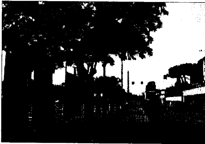
Il lato nord di piazza Garibaldi dove sono iniziati i lavori

Oltre a questi interventi, si provvederà anche allo spostamento degli impianti di pubblica affissione, già indicati da molti come inadatti e certamente poco attraenti alla vista, che saranno collocati in un'altra zona della città. Allontanati dunque dalla vista di tutti coloro che si troveranno fermi al semaforo i poco gradevoli pannelli per l'esposizione di cartelloni pubblicitari e