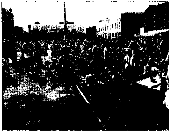
Una foto dello scorso anno delle attività dei bambini in piazza.

Il diritto al gioco è il filo conduttore dell'intero progetto 2002, curato dalla Cooperativa La Giraffa ed intitolato appunto "Tante piazze per giocare". Durante la mattinata di venerdì sono previste dunque iniziative di animazione ed attività realizzate direttamente dai bambini e dai loro insegnanti. Gli alunni delle scuole medie si troveranno poi in piazza Baracca, sotto il loggiato della Banca di Romagna, per realizzare tutti insieme un grande murales intitolato "I colori del mondo" sul tema del diritto al