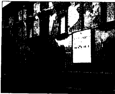
La sede degli Uffici Giudiziari di Lugo

R istrutturazioni e cambi di sede per uffici importanti nel lughese sono all'ordine del giorno in questo periodo. Scadrà infatti il prossimo 11 giugno il termine ultimo fissato dal Comune di Lugo per la presentazione delle offerte da parte delle ditte interessate ai lavori di restauro di Palazzo Rossi, il grande edificio di corso Matteotti al civico 52, proprio di fronte all'intersezione con via Giordano Bruno, meglio conosciuto da tutti i lughesi come il Palazzo della Pretura. Se non si registreranno rallentamenti burocratici oppure altri problemi, l'inizio dei lavori di ristrutturazione del fabbricato di proprietà comunale è previsto entro la fine del 2002 e tutti gli interventi dovrebbero concludersi nel giro di tre anni, con una spesa prevista di tre miliardi e 700 milioni di lire, quantificabile oggi in un milione e 900 mila euro. Un importo davvero notevole dunque per riportare all'antico splendore uno dei palazzi più antichi della città, costruito tra il 1700 ed il 1800, che dal 1927 non gode più di alcun intervento di re-