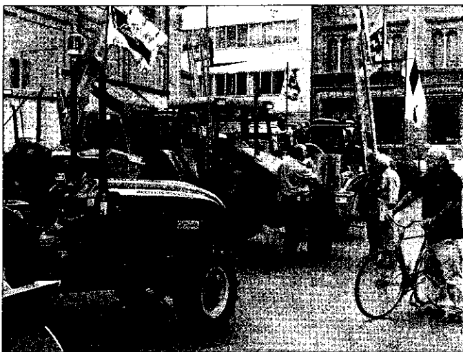
L'edizione 2000 della Fiera biennale lughese registrò novantamila presenze