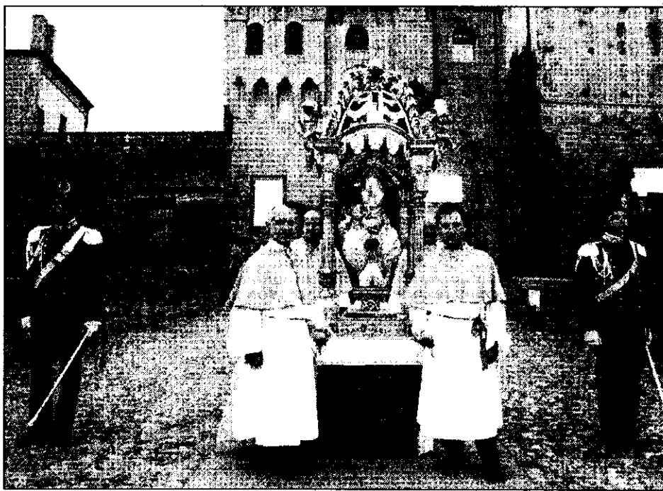
Oggi pomeriggio vi sarà la tradizionale processione con il busto di S. Ilaro

Oggi si festeggia a Lugo Sant'Ilaro, patrono della città. Alle 16, nella galleria della Banca di Romagna, vi sarà un concerto della banda di Galeata, città in cui il patrono è S. Eltero (altro nome appunto di S. Ilaro), mentre alle 18 nella chiesa del Carmine sarà celebrata una messa con i rappresentanti dei 4 rioni a cui seguirà la processione con il busto di S. Ilaro alla presenza di autorità, sbandieratori e musicisti. In serata, dalle 20.30, spettacolo di teatro di strada e quindi, alle 21.15, nella chiesa del Carmine concerto di musica sacra medievale eseguito dal coro 'Sistro' di Bologna. Gran finale poi alle 22.45 in piazza Martiri con uno spettacolo di fuochi d'artificio 'sparati' anche a tempo di musica.