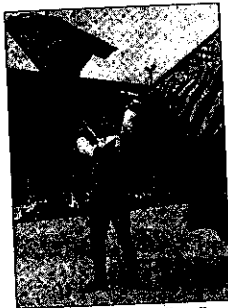
I primi vincitori possono già esultare

Un primo capitolo macchiato comunque dalla scelta del Rione Cento di presentare sabato solamente uno sbandieratore in piazza per la gara del Singolo, rinunciando invece a disputare le altre prove, a dimostrazione che