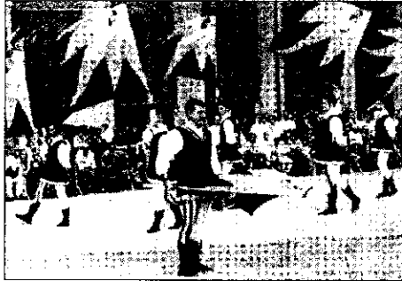
Gli sbandieratori dei rioni lughesi saranno protagonisti anche questa sera nelle finali

Le gare sono iniziate solo dopo il giuramento degli atleti davanti ai rappresentanti dell'Ente Palio ed ai giudici della Federazione Italiana Sbandieratori giunti a Lugo per dare il loro voto alle varie evoluzioni. Nella notte di oggi quindi almeno una contrada potrà iniziare i festeggiamenti per aver