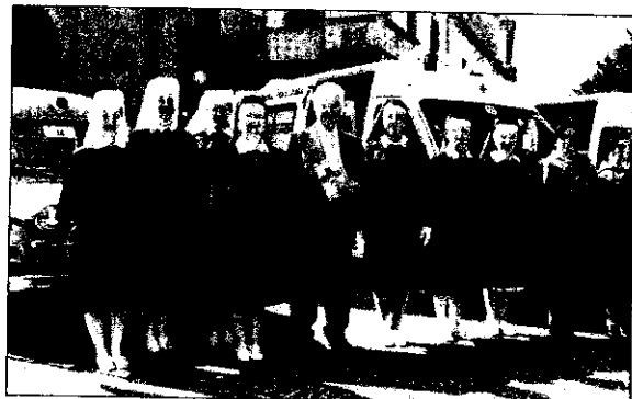
Un gruppo di crocerossine

Continua con grande partecipazione di pubblico e di appassionati la Settimana della Croce Rossa pro-