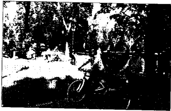
La classica Pedalata di Primavera è giunta alla sua 22.ma edizione

L'appuntamento per quella che è considerata la principale iniziativa di questo genere sul territorio è alle ore 9, davanti allo stabilimento Cevico, nella zona industriale di Lugo, dove saranno distribuiti i biglietti della lotteria e verrà allestito un punto di ristoro con prodotti offerti, oltre che dallo stesso Cevico, da Ala Latte, Crai e Deco. Alle ore 9.30 avverrà poi la partenza dei ciclisti i quali, dopo aver percorso un itinerario di circa dieci km, ar-