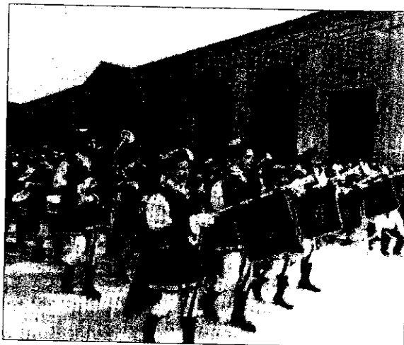
Siamo nel pieno degli spettacoli per il Palio

E le novità in questa edizione non mancano certo, preannunciate nei mesi scorsi da aspre polemiche e da un primo Tiro alla Caveja vinto dal Rione Ghetto. Dopo tante discussioni ora il programma sembra davvero stabilito in via definitiva attorno alla data del 15 maggio quando verrà celebrato S. Illaro, patrono ufficiale della città costretto singolarmente dalla tradizione a condividere la sua fama con San Francesco di Paola, l'altra figura liturgica nella quale la città si riconosce. E così, proprio dopo aver festeggiato San Francesco, tocca ora alla seconda fase nella speranza di rilanciare definitivamente la Contesa. «Uno degli aspetti più delicati del lavoro che stiamo svolgendo - spiega il Magistrato dei