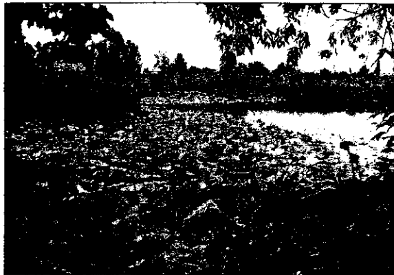
Una veduta del Parco del Loto