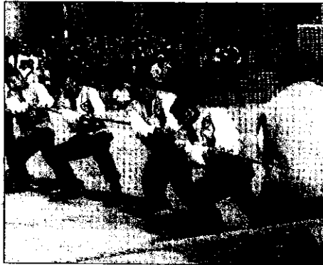
L'edizione 2001 del Palio Estense, un richiamo sempre fortissimo

LUGO - L'antipasto, e che antipasto, è già stato servito con la Sagra di San Francesco che il 21 aprile ha richiamato a Lugo migliaia di persone, ma il bello deve ancora arrivare. E' stata infatti presentata ufficialmente la nuova edizione della Contesa Estense che prenderà il via il prossimo 11 maggio e proseguirà sino a domenica 19 con una lunga serie di iniziative, incontri, gare, manifestazioni pubbliche improntate al medioevo. Le novità in questa edizione non mancano certo, preannunciate nei mesi scorsi da aspre polemiche e da un primo Tiro alla Caveja vinto dal Rione Ghetto. Dopo tante discussioni, ora il programma sembra davvero stabilito in via definitiva attorno alla data del 15 maggio quando verrà celebrato S. Ilaro, patrono ufficiale della città costretto singolarmente dalla tradizione a condividere la sua fama con San Francesco di Paola, l'altra figura liturgica nella