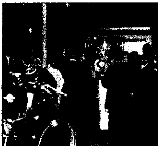
Molti i visitatori che erano presenti all'inaugurazione della mostra