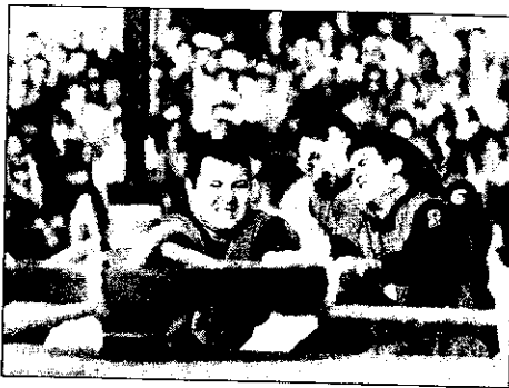
La 'Contesa' culminerà il 19 maggio con il Palio della Caveja. A destra la presentazione della 33ª edizione