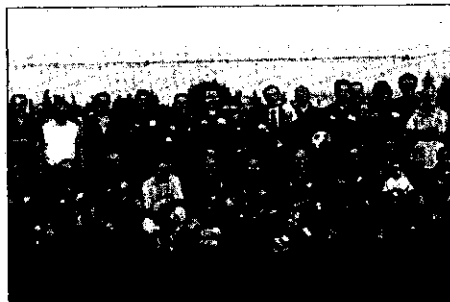
La squadra degli amministratori della provincia di Ravenna