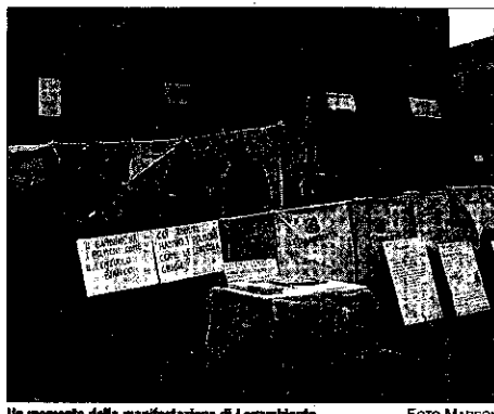
Un momento della manifestazione di Legambiente