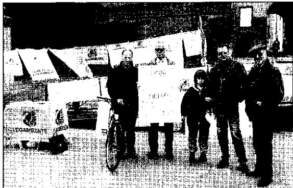
I lenzuoli e i cartelli esposti da Legambiente ieri davanti alla Rocca