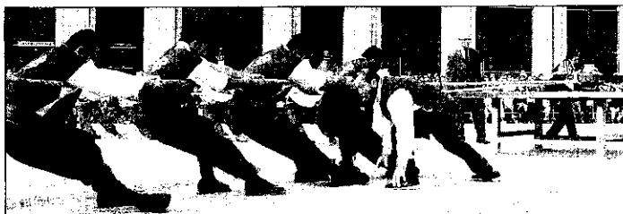
Il rione Ghetto non voleva partecipare al palio di S. Francesco, poi tutto si è appianato

Eccezionalmente quest'anno Lugo vedrà due gare di tiro alla fune tra i quattro rioni cittadini, perché la tradizionale Sagra di San Francesco propone, oggi pomeriggio, il 'Palio della Caveja' appunto di S. Francesco che assegnerà il quinto 'Memorial Sgubbi'. La sfida avrà inizio alle 17.30 e verrà disputata con qualsiasi tempo, ma fino alle 13 di ieri la manifestazione ha rischiato di saltare, o quanto meno di essere disputata solo da tre rioni. Alla vigilia infatti della manifestazione i rappresentanti del rione Ghetto si erano impuntati a non disputare il Palio della caveja per questioni complesse che in pratica si rifanno alle travagliate vicende dei mesi scorsi che avevano portato alla squalifica dal Palio del rione Cento, poi riammesso dopo un patto di buona volontà sottoscritto dalle quattro contrade. Cento allora non si riconosceva più nell'Ente Palio, ma aveva accettato di partecipare all'edizione 2002 della Contesa estense che prevede appunto un tiro alla fune oggi e quello tradizionale nel corso delle manifestazioni in programma in maggio. Allora, se il rione si era 'chiamato fuori' dal Palio, hanno rilevato i rappresentanti del rione Ghetto cosa accadrebbe se oggi dovesse essere premia-