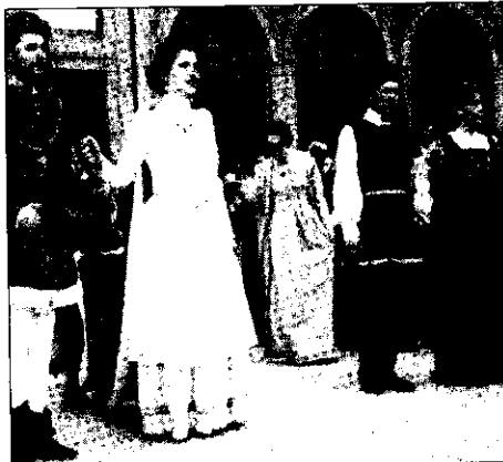
Qui sopra e in basso, alcuni momenti delle scorse edizioni della Sagra di San Francesco di Paola, una festa sempre molto sentita dai lughesi

Un appuntamento che nei mesi scorsi era stato messo a serio repentaglio per una serie di discussioni, litigi e polemiche che, almeno per il momento, sembrano essere state accantonate: "Come Amministrazione comunale