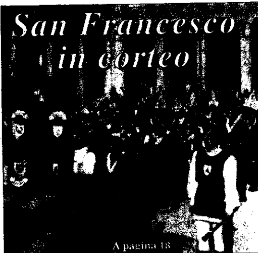
A pagina 18