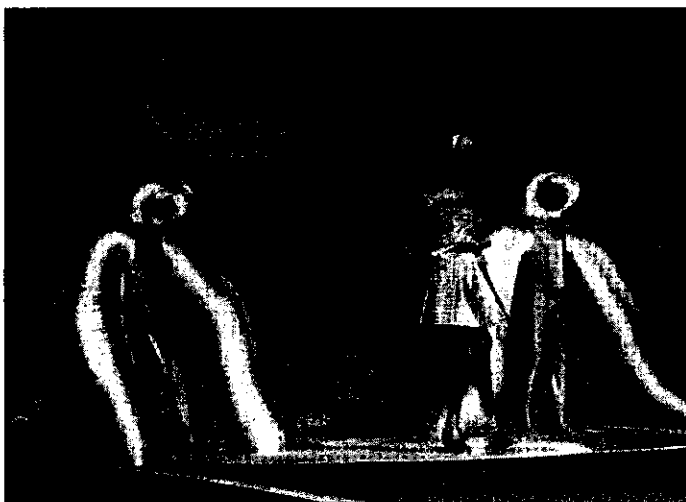
Un momento di una precedente edizione di "Gemme di Primavera"

In quello che da sempre è considerato come il cuore storico del settore commerciale lughese si potranno dunque ammirare ballerine che volteggeranno con leggerezza sulle note di brani degli anni Cinquanta scelti come colonna sonora dell'evento e come simbolo di quel periodo, oggi interpretato dal gusto e dalla creatività delle griffe più note attraverso i