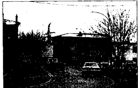
L'incrocio Porta Brozzi a Lugo

LUGO - Dopo l'annuncio dei mesi scorsi ed i primi interventi al vicino canale, prenderanno il via, oggi, i lavori di costruzione della rotonda di via Foro Boario davanti al Penny Market in corrispondenza con quella che viene considerata la porta di Lugo per coloro che giungono in città provenienti da Bologna. Si darà dunque il via, con questa prima operazione, ad un progetto più vasto compreso nel Piano urbano del traffico, che prevede in tutto ben quattro rotonde in grado di regolare e di migliorare il traffico sul circondario e quindi alleggerire il centro storico dal passaggio di molte vetture che oggi lo attraversano per recarsi da una parte all'altra di Lugo. Oltre a questa rotonda, che sarà realizzata a spese della società che ha lottizzato l'area del Penny Market, il Piano ne prevede infatti altre tre negli incroci di Porta Ghetto, Porta Brozzi ed in quello di via Acquacalda - via di Giù, che saranno costruite successivamente a spese dell'Amministrazione comunale. Durante il periodo di svolgimento dei lavori, che è previsto intorno ai sessanta giorni circa, nella via Foro Boario, nel tratto fra via Brignani e Porta Brozzi, sarà interdetta la circolazione al traffico pesante. Verrà invece consentito senza