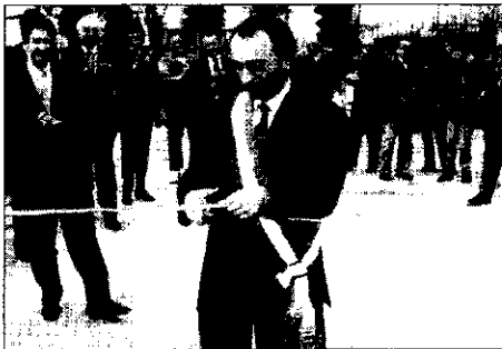
'Lugo sarà più bella quando saranno terminati tutti i lavori in corso, basta pazientare un po': parola di Roi

«La maggioranza dei cittadini si è espressa a mio favore nelle ultime consultazioni amministrative e il mio compito è quello di dimostrare di aver meritato la fiducia di oltre il 50 per cento della popolazione. Per cui io devo lavorare non solo per chi mi ha eletto, ma anche per gli altri. Essere simpatici o meno non