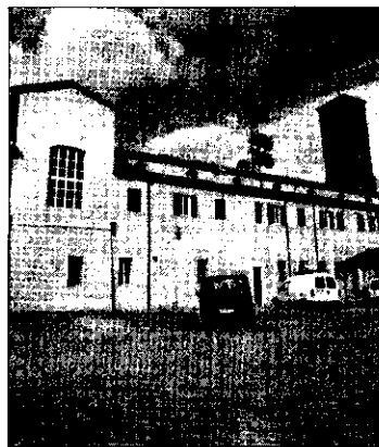
La residenza sanitaria San Domenico