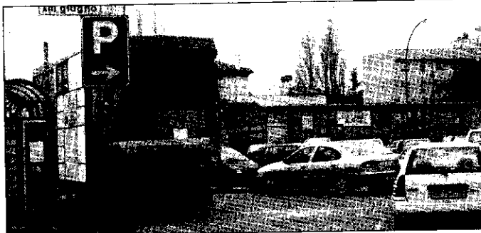
Piazza XIII Giugno al centro di polemiche per la decisione di 'venderla' a privati