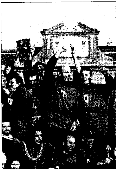
Dissipate le nuvole sulla prossima edizione della Contesa estense. La manifestazione si farà: previsto anche un tiro della Caveja nella sagra di S. Francesco