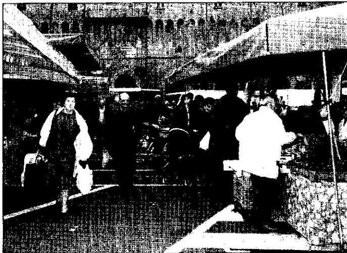
Giunta comunale e opposizione sono, per una volta, d'accordo. Per rilanciare il mercato ambulante lughese occorre raddoppiare gli appuntamenti settimanali.