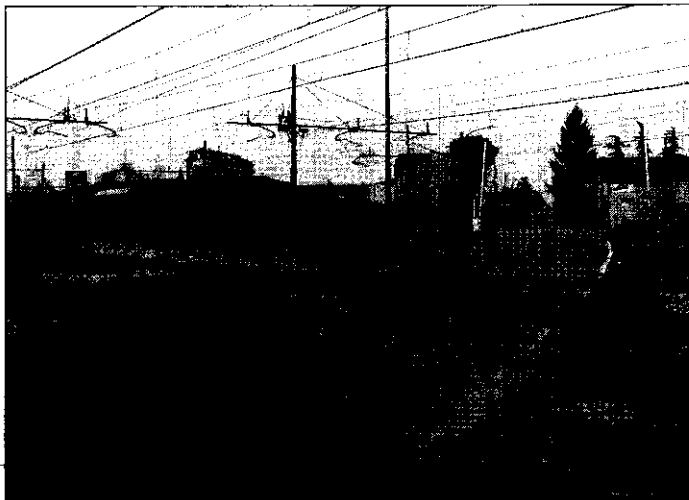
Con la costruzione di un sottopasso nella zona della nuova stazione delle corriere, il passaggio a livello di via Rivali S. Bartolomeo verrà chiuso.

e un nuovo ingresso, dalla parte opposta, dove gli utenti delle ferrovie potranno trovare nuovi parcheggi per le automobili». Un sottopasso ciclopedonale, previsto nella zona di via Piano Caricatore e un sovrappasso carrabile da realizzarsi nella zona del parcheggio dell'ospedale, consentiranno la chiusura anche del passaggio a livello di via Piano Caricatore. Per quanto riguarda la viabilità, è previsto il completamento dell'anello attorno a Lugo — che attualmente esiste solo nella parte a nord ed è costituito da via Piratello — in grado di smaltire il traffico di attraversamento e diminuire quello che gravita sul Circondario. La terza parte del progetto riguarda il Campus scolastico: in sostanza è un Piano di riqualificazione urbana che comprende l'attuale area scolastica, dove sorge l'Istituto tecnico commerciale, il liceo scientifico, che sarà ampliato per ospitare anche il classico, il palazzetto dello sport e l'edificio ex Omni che ospiterà i corsi di formazione multimediale del Consorzio provinciale per la formazione professionale e l'incubatore per nuove imprese del settore multimediale, e la zona a est della stazione, dove sorgeranno le nuove sedi degli istituti professionali ora in centro città. Nell'ambito del Campus è prevista la costruzione di un sovrappasso pedonale ad uso delle scuole per collegare direttamente le due parti del Campus stesso.