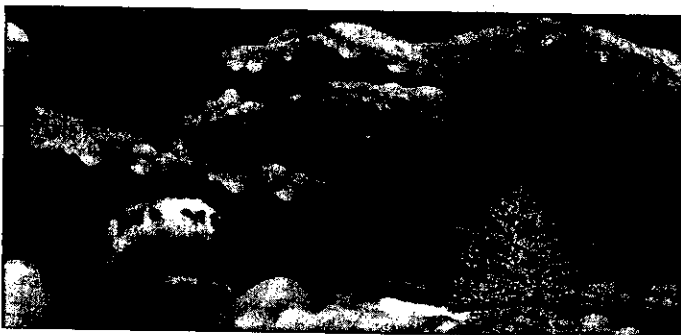
Anche quest'anno sono tante le iniziative natalizie che porteranno i lughesi in centro città

Da quell'"enorme contenitore" che è il depliant "Mille & un Natale" redatto dal Servizio Commercio dell'Amministrazione Comunale di Lugo (che raccoglie ben 76 iniziative nei settori i più diversi), riprendiamo le proposte per la prossima settimana. Sabato 8 dicembre, dalle ore 15, nelle piazze e nelle vie del centro, animazione con artisti di strada ed esibizioni di go-kart e in via