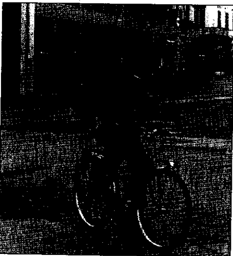
Andare in bici senza mani è un comportamento pericoloso per sé e per gli altri