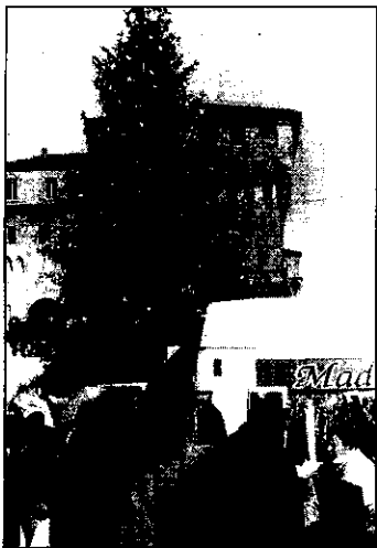
Il tradizionale Albero di Natale verrà innalzato nella piazza del Pavaglione

Quest'anno il Natale a Lugo inizia prima. Sia perché le luci, non ancora montate, si illumineranno in anticipo sia perché la città si animerà già da domenica prossima. A permetterlo è lo sforzo congiunto realizzato dagli uffici comunali, impegnati dalla fine di agosto nella stesura del programma 'Mille e un Natale', dalla Pro Loco e da oltre 40 associazioni ed enti privati. Una mobilitazione generale che darà modo ai lughesi e ai visitatori esterni di poter gustare fino in fondo le iniziative proposte, concluse dalla grande festa di San Silvestro. Altra novità è rappresentata dal concorso fotografico 'Mille e una foto' diretto a chi, grande o piccolo che sia, ama la fotografia ed è interessato a cogliere aspetti inediti della Lugo illuminata e dei lughesi durante l'ultimo dell'anno. Il grande albero di Natale occuperà straordinariamente la piazza del Pavaglione e sarà decorato con gli oggetti realizzati dai bambini del 'nido' e delle scuole di infanzia pubbliche e pri-