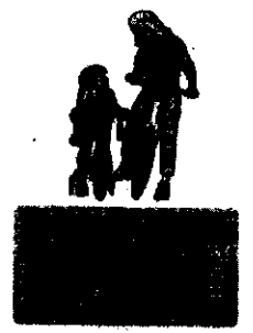
Il logo della campagna per la sicurezza in bici.

LUGO - Dopo il cono gelato in premio per i minorenni bravi a rispettare le norme del Codice della Strada e ad indossare il casco in moto, idea inserita nella campagna "Casco Goloso" lanciata nei mesi estivi, il comando di Polizia Municipale di Lugo, S. Agata e Bagnara lancia ora una nuova iniziativa legata alla viabilità ed al corretto comportamento sulle strade. Un nuovo progetto formativo, questa volta indirizzato ai tanti ciclisti che quotidianamente si muovono in sella ad una bicicletta nel centro della città e che troppo spesso ignorano le più elementari norme presenti. La campagna, denominata "Se in bici sicuro vuoi andare rispetta le regole... non basta pedalare", ha preso il via da pochi giorni e si concluderà il 10 dicembre dopo un mese di attività a ritmo serrato per insegnare a tutti il corretto uso dei due pedali.