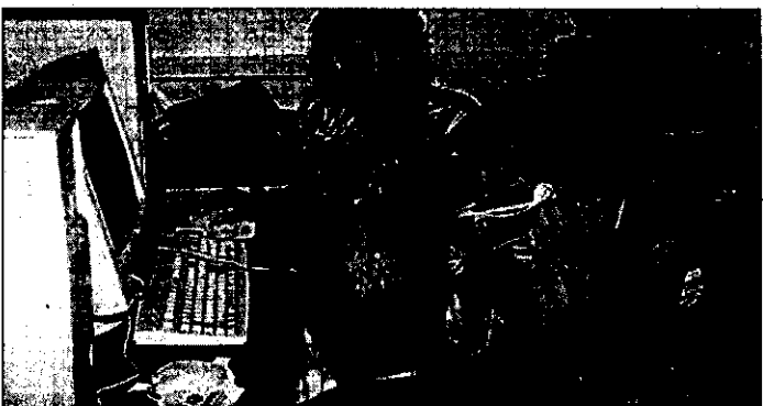
L'obiettivo del progetto del Comune di Lugo è quello di portare un computer in ogni casa e insegnare ad usarlo