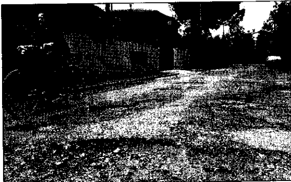
L'attuale stato di via Jacopo della Quercia