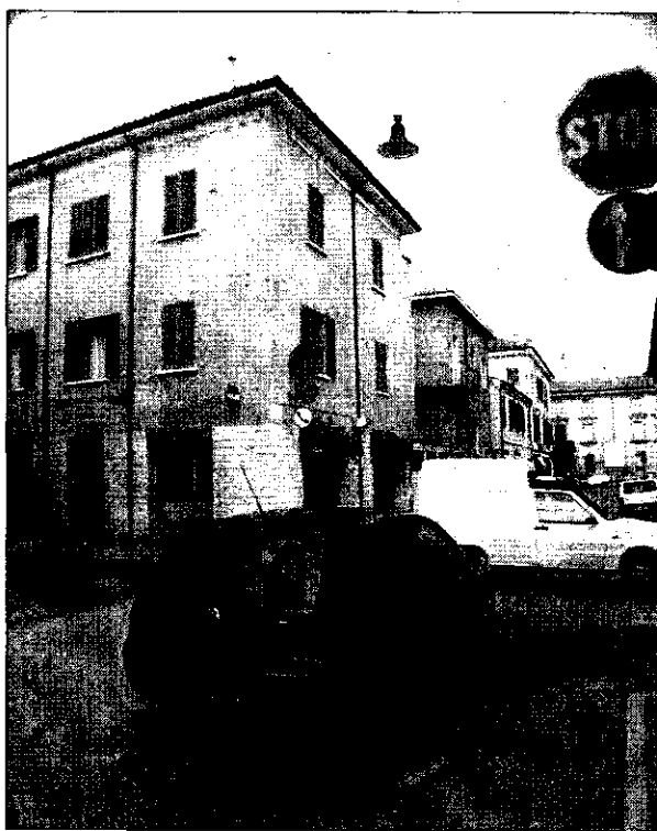
Il Comune sistemerà anche la segnaletica nell'incrocio pericoloso

zione soprattutto per le categorie più a rischio: ciclisti e pedoni. La messa in sicurezza dell'incrocio tra via Ricci Curbastro e via Tellarini è dunque prevista da tempo e, in attesa di interventi più consistenti, nelle prossime settimane sarà realizzata in quell'incrocio una apposita segnaletica orizzontale. Nella situazione attuale non è possibile invece intervenire sulla segnaletica verticale, sui cartelli giudicati ad altezza eccessiva da alcuni automobilisti. Infatti, in una posizione più bassa il segnale di stop potrebbe essere colpito da furgoni o altri automezzi». Infine Valgimigli intende fare due precisazioni: «Qualcuno ha affermato che in quell'incrocio vi sia un incidente ogni cinque giorni, mentre in base ai dati in nostro possesso risultano, dall'inizio dell'anno ad oggi, due incidenti senza feriti rilevati dalla Polizia municipale e un incidente con un ferito rilevato dai Carabinieri. Infine vorrei ricordare che gli agenti di Polizia Municipale sono costantemente impegnati su tutto il territorio comunale ad effettuare controlli sulla velocità, i quali portano spesso ad elevare contravvenzioni».