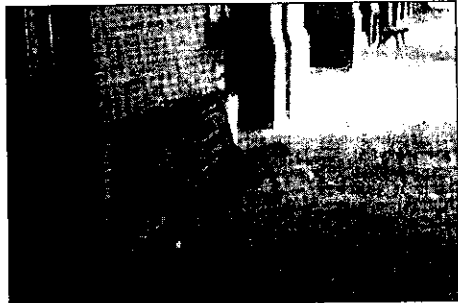
Alcune delle opere installate per abbellire il centro di Lugo

La soddisfazione per il nuovo arredo riguarda tutta la Giunta: "Con questi interventi - spiega l'assessore