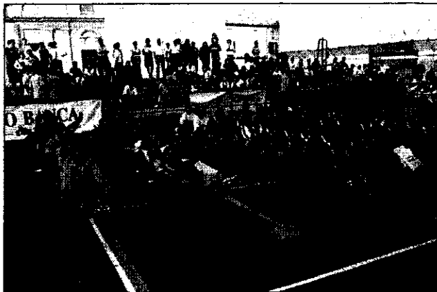
Una manifestazione sportiva fra ragazzi europei svoltasi nella scorsa edizione

Il programma della manifestazione prevede una serie di appuntamenti che prenderanno il via a settembre per concludersi verso la fine dell'anno, in corrispondenza con l'entrata in circolazione della nuova moneta comune. Ad aprire le danze sarà ancora una volta il torneo internazionale di pallavolo “F. Baracca” che dal prossimo 7 settembre vedrà la partecipazione di squadre locali e di formazioni provenienti da altre nazioni europee composte da ragazze under 17. Le partite, organizzate in collaborazione con la Pgs Robur Lugo, si svolgeranno in uno scenario particolare ma già utilizzato come quello rap-