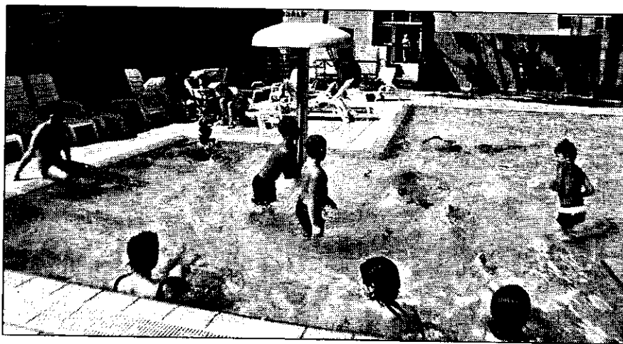
I gestori della piscina di Lugo vogliono costruire una terza vasca.