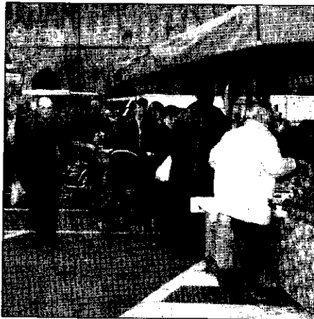
Dal mercato ambulante alle iniziative serali, migliaia di persone hanno 'invaso' mercoledì il centro di Lugo

Oltre ventimila presenze alle iniziative dei mercoledì sera di luglio in centro a Lugo costituiscono il bilancio molto positivo della serie di appuntamenti organizzata dai commercianti di via Baracca, di corso Garibaldi e del Pavaglione. «Crediamo proprio di aver saputo cogliere — sottolineano diversi esercenti del centro — le attese dei lughesi e non solo, visto che dalle 200 interviste effettuate tra le persone che hanno affollato il centro nelle ore serali, ben un terzo proveniva da fuori città. L'eco di queste serate è stato tale che un hotel di Cervia ha organizzato un pullman per portare a Lugo i suoi clienti». Anche l'amministrazione comunale ha sottolineato il successo dei 'Mercoledì in centro', «un'iniziativa riuscita grazie ai commercianti che hanno aderito e alle associazioni di categoria che hanno prestato il supporto organizzativo. La serie di appuntamenti del mercoledì sera è stata resa possibile, malgrado i tempi strettissimi della proposta, proprio per il clima positivo instauratosi tra Comune, associazioni di categoria e operatori». E già si parla, sia da