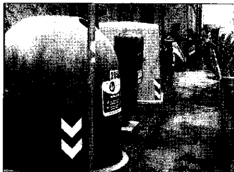
Le tariffe per i rifiuti, dice Team, sono sperimentali.

Da alcune settimane sono arrivate, nelle case dei cittadini di Alfonsine, Fusignano e Lugo le prime bollette dei rifiuti i cui importi sono riferiti all'applicazione della tariffa che ha sostituito la tassa. E, come sottolinea Team, la società Territorio e ambiente che cura il servizio dei rifiuti nel comprensorio lughese, sono state moltissime le persone, «circa quattromila che si sono rivolte ai nostri sportelli e al numero verde per chiedere chiarimenti e porre quesiti. E questo anche perché ognuno si è trovato a fare i conti con le norme regolamentari che disciplinano dettagliatamente l'applicazione del nuovo tributo». Fra le domande poste più frequentemente dai cittadini, rilevano ancora al Team, «vi è quella relativa agli appartamenti sfitti. Questi, pur non essendo occupati, pagano un importo della parte variabi-