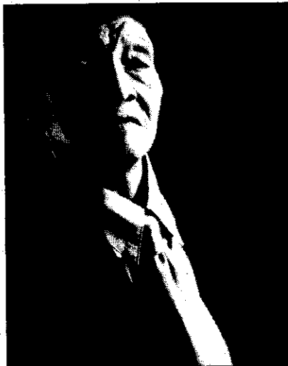
Jimmy Scott: è nato nell'Ohio nel '25