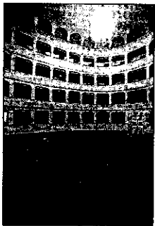
A lato una veduta interna del teatro Rossini di Lugo

In questo modo, l'Amministrazione comunale di Russi, non disponendo al suo interno delle professionalità necessarie per far fronte alle esigenze che impone la programmazione e la gestione di uno spazio teatra-