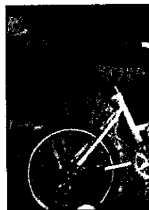
Primi approcci con la bici per una bimba

LUGO - Le numerose manifestazioni promosse nei giorni scorsi nelle piazze e nelle strade dei centri storici del comprensorio, ed in particolare quelle dedicate ai bambini con le piazze chiuse al traffico, hanno offerto diversi spunti di approfondimento. Tra questi si segnala anche quello del Circolo lughese di Legambiente "Cederna" che recentemente ha inviato una lettera aperta al sindaco di Lugo Maurizio Roi ed all'assessorato comunale alla Mobilità affrontando il tema dell'uso delle due ruote inserito nel contesto della discussione sul nuovo Piano Traffico. "Pur sottolineando l'importanza della manifestazione Città dei bambini e delle bambine - si legge nella nota - il Circolo ribadisce l'importanza della sicurezza e della limitazione del traffico cittadino. Lo stesso traffico influisce negativamente sullo sviluppo dei bambini in quanto ne limita lo spazio vitale e per questo l'Amministrazione deve fare di più, incentivando l'uso della bicicletta e favorendo la sicurezza sul percorso casa-scuola con piste ciclabili sicure e collegando i diversi