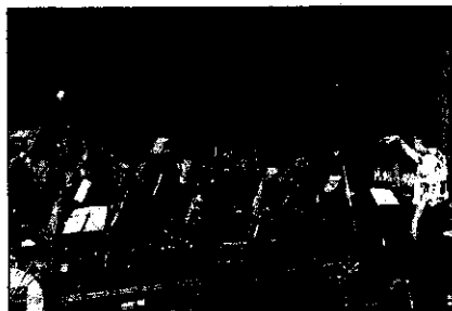
Sopra l'Amr Big Band. Sotto Deppe Servillo