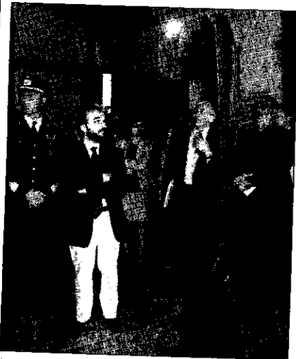
Le autorità in visita al museo Baracca