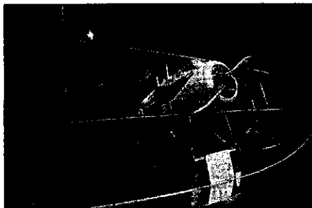
L'aereo di Francesco Baracca, in alto il cavallino della Ferrari

LUGO - Dopo la presentazione avvenuta nei giorni scorsi è giunto anche il momento per le celebrazioni vere e proprie organizzate in occasione della festa del Cavallino Rampante, simbolo del celebre aviatore Francesco Baracca, eroe della Prima Guerra Mondiale, ma anche dei bolidi rossi della Ferrari legati in questo modo alla città di Lugo. Le iniziative, organizzate dall'Amministrazione comunale nell'ambito del progetto Lugo Città Mercato, prevedono un grande omaggio collettivo al mito delle quattro ruote di Maranello che in questi anni ha reso onore al Cavallino di Baracca e prenderanno il via nella giornata di oggi quando dalle ore 10 alle 12 diversi esemplari di Ferrari potranno essere ammirate nella cornice di piazza dei Martiri. Alla presenza delle autorità locali e di alte cariche dell'Aeronautica si svolgerà poi la cerimonia di riapertura del museo Baracca dopo la recente ristrutturazione, un appuntamento che riserverà sorprese e novità interessanti per uno dei luoghi di maggior