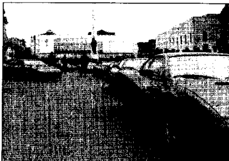
Le Ferrari in piazza nell'edizione 2000 della festa