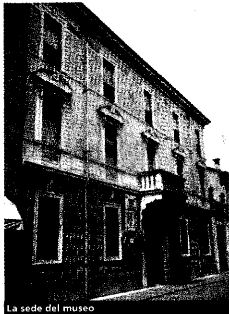
La sede del museo