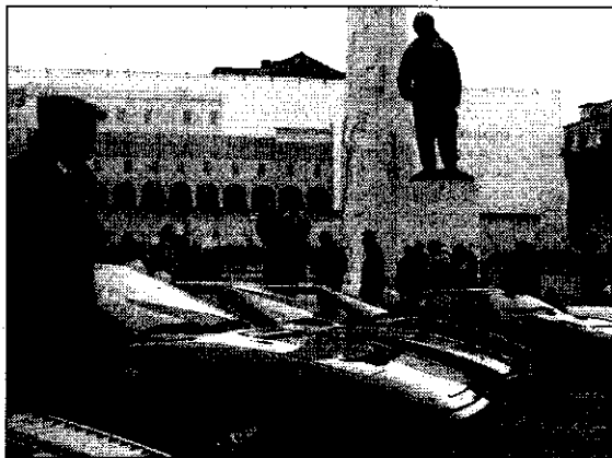
La Ferrari torneranno in piazza a Lugo il 9 e 10 giugno

E' il rosso il colore che tingerà l'atmosfera di Lugo il 9 e il 10 giugno prossimi. Non un rosso qualunque, ma quello scintillante targato Ferrari. Oltre cinquanta vetture con il marchio della scuderia modenese, arriveranno in città per la seconda edizione della festa dedicata alle rosse di Maranello ed in particolare al cavallino rampante, simbolo delle rosse e di Francesco Baracca. L'avvio della manifestazione è anticipato alla inaugurazione della mostra dedicata alla storia della Ferrari che si aprirà domani, sabato, alle Pescherie della Rocca. Il percorso sarà distinto in due settori, il primo riservato al famoso aviatore e alle origini del simbolo; il secondo alle mitiche rosse raccontate da 400 modellini messi a disposizione da collezionisti di tutta Italia, suddivisi per annata e completati dalla riproduzione della foto della vettura in corsa o del pilota. La festa vera e propria inizierà alle 10 di sabato 9 giugno in piazza