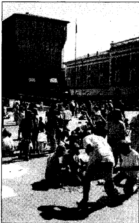
La pacifica invasione della piazza, lo scorso anno, da parte dei bambini.

L'ambiente, la magia, i giochi e la fantasia dei bambini saranno il filo conduttore della manifestazione 'Lugo città sostenibile dei bambini e delle bambine', promossa dagli assessorati comunali alla pubblica istruzione, alle politiche sociali e culturali, all'ambiente. Il programma propone vari appuntamenti, a partire da venerdì prossimo, quando, alle 17 nella sala ragazzi della biblioteca Trisi aprirà 'Clorofilla dal cielo blu', una mostra di libri per ragazzi sul tema dell'ambiente e delle scienze, realizzata dalla cooperativa culturale 'Giannino Stoppani' e prodotta da Team Spa, e si terrà la prima lettura animata, dal titolo 'Nave d'erba'. Si proseguirà giovedì 31 maggio, in piazzale Tiziano, con l'inaugurazione alle 15.30 di un'area verde progettata dai ragazzi delle scuole elementari e medie e alle 16 con 'La foresta della strega vampira', spettacolo gioco animato. Il momento clou della manifestazione sarà venerdì 1 giugno quando, in mattinata, quasi duemila bambini, provenienti da asili nido, materne, scuole elementari e me-