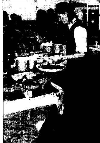
In questi giorni sono state costituite le Commissioni mense scolastiche.

frirne pasti equilibrati, prodotti con materie prime di qualità, correttamente preparati e con un buon livello di gradimento». Da segnalare poi che da alcuni giorni è iniziata una sperimentazione, realizzata con la consulenza degli esperti dell'Ausl, per l'utilizzo di prodotti biologici. La sperimentazione interessa circa 300 studenti, di età fra i 3 e i 13 anni, che frequentano scuole di Lugo e di altri Comuni. L'indagine avrà una durata di cinque settimane e riguarderà il consumo di pasta e riso biologico. Alla fine di ogni pasto verranno pesati gli scarti e ritirati i questionari gradimento. Nelle prime tre settimane i pasti biologici saranno introdotti senza comunicarlo preventivamente, mentre nelle settimane successive il test avverrà dichiarando preventivamente l'origine del prodotto. Il costo per realizzare questa sperimentazione sui prodotti biologici è sostenuto dalla società 'Lugo catering', da Ausl e Comune di Lugo.