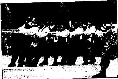
Gli uomini del rione Madonna delle Stuoie hanno dominato.

LUGO - Madonna delle Stuoie trionfa per la terza volta consecutiva nel "Palio della Caveja", l'evento clou della Contesa estense di Lugo. In un Pavaglione straripante di pubblico e di figuranti gli uomini del Rione Madonna delle Stuoie hanno vinto la sfida del tiro alla fune, conquistando la caveja per la 19esima volta, grazie ai 15 punti conquistati. Secondo (13 p.) il Ghetto, terzo Brozzi (12) e quarto Cento (2). Nella gara dei tamburini svoltasi sabato sera ha invece dominato Cento con 49 punti, seguito da Brozzi (32), Ghetto (27) e Madonna delle Stuoie (17).