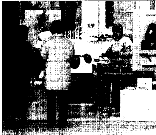
Le associazioni dei commercianti continuano a esprimere critiche sul nuovo sistema tariffario riguardante lo smaltimento dei rifiuti.

sultato ottenuto dalla protesta dei mesi scorsi consiste, secondo le due associazioni, nell'impegno assunto dai sindaci di concepire le nuove tariffe solo in via sperimentale. «Pur non condividendo le scelte generali dei Comuni che hanno portato a penalizzare molte categorie del commercio e dell'artigianato, ora ci impegnamo a far correggere le incongruenze più macroscopiche che emergeranno nella fase di completa applicazione. Per questo motivo abbiamo aderito all'invito che ci ha formulato l'Associazione intercomunale della Bassa Romagna di partecipare a un confronto su tali problematiche». Le associazioni concludono la loro presa di posizione sottolineando come «contrariamente a quanto qualcuno ha affermato, la nostra non è una battaglia corporativa. E confrontandoci con i Comuni del comprensorio intendiamo perseguire l'obiettivo di far modificare sostanzialmente il sistema tariffario proposto, anche per evitare che nel prossimo triennio alcune attività siano costrette a pagare anche il 400 per cento in più rispetto alla vecchia tassa».