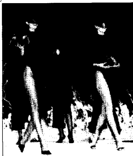
Lugo ha ospitato una sfilata anche lo scorso ottobre con la manifestazione 'La moda incontra il teatro'.