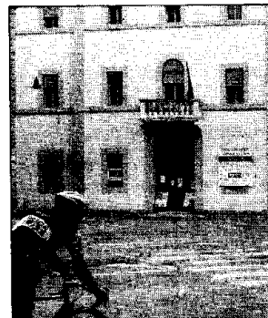
Il consiglio comunale sarà ospitato temporaneamente a palazzo Trisi.

a sinistra del corridoio centrale e posti su predelle rialzate su due livelli. Al pubblico sarà riservata una galleria che unirà i due lati della sala. Tutti gli spazi saranno unificati da un graticcio in legno ispirato alle strutture dei soffitti dei teatri storici che farà da supporto agli impianti tecnologici (illuminazione e diffusione sonora). Sulle pareti sarà applicato uno stucco di colore azzurro lapislazzuli, il soffitto invece sarà di colore chiaro. L'intervento riguarderà anche l'antisaia consiliare dove sarà ricollocata la porta originale e dove si svolgeranno lavori di ristrutturazione del pavimento, alla sistemazione dei rivestimenti dei muri e del soffitto e alla sostituzione degli infissi.