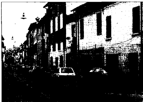
I lavori di ristrutturazione di corso Matteotti sarebbero dovuti iniziare lunedì 19 marzo. L'intervento è stato rinviato anche su richiesta dei commercianti.