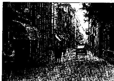
Gli ambientalisti chiedono che vengano chiuse alcune strade del centro storico