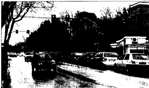
Per snellire la viabilità nella zona dell'ospedale, al posto dell'incrocio di viale Masi regolato dal semaforo verrà realizzata una rotonda.