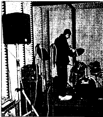
La sala prove del centro giovani. Le band musicali hanno maggiori opportunità

Il documento in questione si inserisce nell'ambito del progetto Sonora, avviato dalla Provincia di Ravenna circa due anni fa. Fra le prime iniziative realizzate in questa ottica va ricordata l'attivazione del sito web nella rete Internet www.sonora.ra.it che monitorizza la situazione della musica giovanile nel territorio provinciale e fornisce un servizio di informazioni on line su diverse tipologie di musica giovanile. L'obiettivo dell'accordo di programma è poi quello di continuare il percorso avviato, nell'intento di favorire e