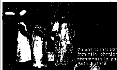
Da una scena: Una famiglia ebraica commenta la nascita di Gesù