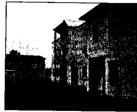
A tale scopo sarà predisposta una carta di servizio.

Ogni Comune avrà un contratto diverso dall'altro in base alle esigenze del territorio nell'erogazione dei servizi.