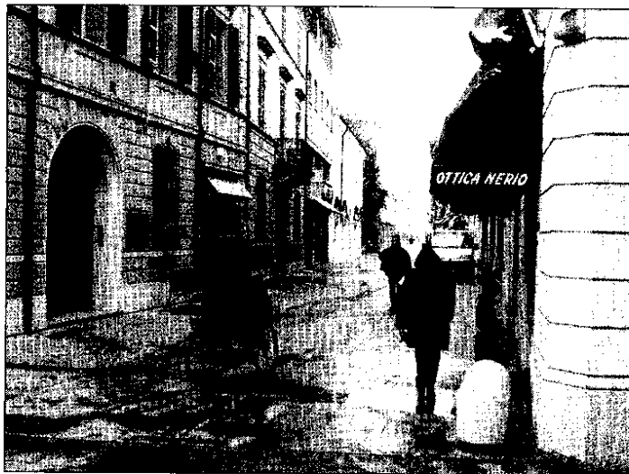
L'inizio della zona blu in via Baracca. Si notano i 'panettoni' appoggiati al muro.

Il colore blu non sembra attirare le preferenze dei lughesi. Soprattutto se lo si associa alla viabilità e al traffico in alcune zone della città. Così sempre più spesso c'è chi, avendo il permesso di transitare in centro, percorre in auto l'area pedonale di Lugo, dall'inizio di via Baracca al monumento dedicato al celebre aviatore e viceversa, a velocità non moderate, anzi decisamente pericolose. La cosa non è passata di certo inosservata. A lamentarsi sono per lo più i genitori, preoccupati per l'incolumità dei loro figli, soprattutto se piccoli. Si sa, è difficile tenere a bada un bimbo quando gli si dà la possibilità di correre in uno spazio aperto come può essere l'area di nuova pavimentazione realizzata fra il Pavaglione e via Baracca, di fronte alla chiesa di Sant'Onofrio. «Transitano a velocità sicuramente superiori ai limiti previsti in città, senza rendersi conto di costituire un grave pericolo per pedoni e ciclisti. Non si fanno alcuno scrupolo. E dire che si tratta di una zona pedonale — lamenta una mamma — dove la gente porta i bam-