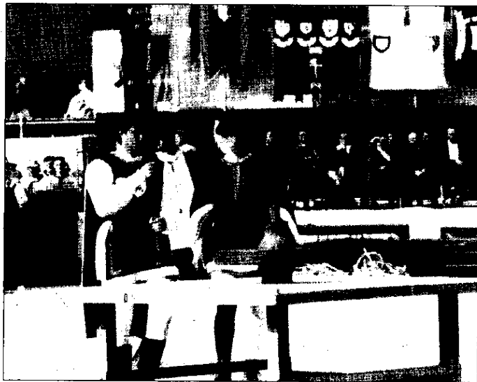
m.s. E' quasi pronto il piano di rilancio del Palio. In cantiere anche una novità gastronomica

più stretta per riuscire a concretizzare antichi obiettivi: fare della manifestazione un'iniziativa di punta della città. Affidato a due veterani, il piano di rilancio sarà pronto a breve: «L'importante è che l'impegno coinvolga tutti con lo stesso entusiasmo e disponibilità» precisa Pieri, mentre restano i nodi della sede dei rioni, degli spazi di allenamento, della necessità di arricchire la manifestazione di un punto gastronomico che forse vedrà la luce nel 2002. Infine, le date della prossima edizione: 28 aprile rievocazione del passaggio di Borso d'Este, 5 maggio Palio dei Musicisti, 6 maggio Palio della Caveja; il 15 maggio si festeggerà Sant'Illaro, con la tradizionale disfida e la novità del concerto di campane o di musica medievale. Il 19 maggio grande conclusione col Palio degli sbandieratori e l'assegnazione del Palio della Contesa Estense.