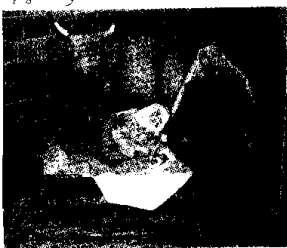
Il presepe di Villa Friat

Un altro bel concerto si terrà a Porto Corsini il 23 dicembre alle 20.30 nell'area adiacente il cortile parrocchiale in una struttura accogliente e riscaldata che vedrà la partecipazione del coro