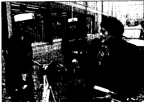
Due vigilesse ascoltano le lamentele di una signora

Il servizio sarà esteso a queste zone nei prossimi mesi, quando l'organico del comando — in bilico tra trasferimenti di personale in mobilità e arrivi di nuovi vigili da istituire — troverà un nuovo assetto. Intanto i vigili presidiavano le zone in cui il servizio è già attivo. Trovarli è semplice. Per migliorare il servizio è poi in programma un corso di formazione. In quanto alle lamentele, nulla di particolare: passi carrai non rispettati, qualche rumore di troppo e via dicendo.