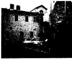
Rsa San Domenico

Un nuovo accordo prevede la gestione integrata - fra Comuni, Ausl, Opere Pie, sindacati e cooperative - delle attività sociali e sanitarie in favore della terza età