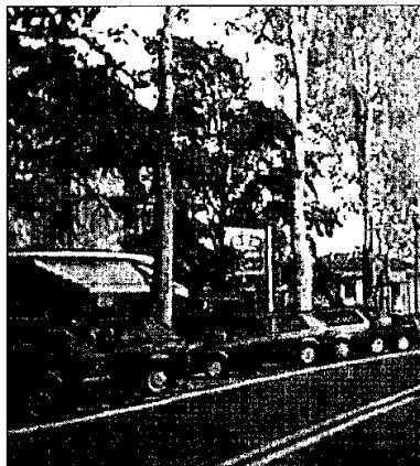
La nuova disposizione dei posti per le auto in viale Dante, a spina di pesce

LUGO - Dopo tante discussioni, proposte e soluzioni temporanee modificate in un secondo tempo, finalmente per la zona di viale Dante, nei pressi di quello che diverrà in futuro l'ingresso principale dell'ospedale, è giunta una nuova disposizione delle aree di sosta. Nella giornata di venerdì infatti il personale incaricato dall'amministrazione comunale ha realizzato le nuove righe sull'asfalto, cancellando quelle disposte pochi mesi fa che imponevano di parcheggiare le vetture in posizione parallela alla carreggiata. Quella sistemazione aveva portato con sé polemiche sin dal primo giorno sia per la posizione delle automobili, sin troppo a ridosso del normale flusso veicolare, e dunque a rischio incidenti, sia per la riduzione sensibile di posti.