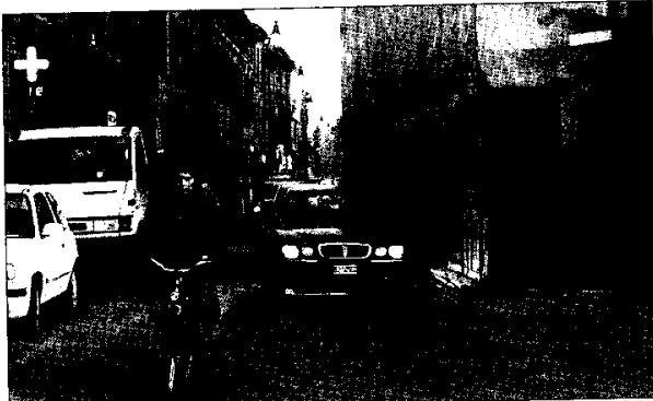
I cantieri di via Matteotti riducono notevolmente la sede stradale.