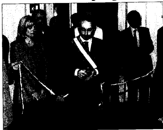
Il sindaco Maurizio Roi taglia il nastro della nuova Residenza sanitaria.

Taglio del nastro ieri pomeriggio per la nuova Residenza sanitaria assistenziale lughese situata nell'ex convento di San Domenico in via Eraldi. Alla cerimonia erano presenti i principali rappresentanti dei Comuni del comprensorio e del Distretto sanitario lughese. La nuova struttura, entrata in funzione nel settembre scorso, si compone di due "moduli" da venti posti ciascuno con un Centro diurno con 25 posti. Grazie alla ristrutturazione dell'imponente complesso, che ha comportato una spesa di nove miliardi di lire, «è stato pos-