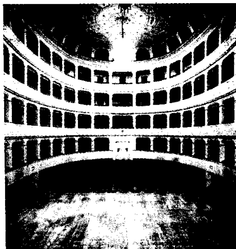
Lugo, Teatro Comunale "G. Rossini"

Il 16 novembre una nuova produzione di "Ernani" inaugurerà la stagione d'Opera e Balletto 2000/2001 del teatro Alighieri di Ravenna. Altra proposta arriva dal Piccolo di Forlì con i quattro professori matti della Banda Osiris che dirigeranno alla loro maniera "SOL La muSica rideRE MI FA" (il 17 e il 18, ore 21). Colpi di scena ed equivoci con "La signora omicidi" interpretata da Valeria Valeri in scena al teatro Comunale di Cervia il 25 e 26; comicità con Maurizio Crozza in "La vita non è rosa e fiore" giovedì 30 sempre alle 21.