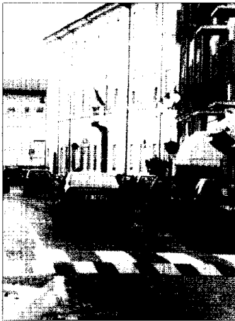
La biblioteca Trisi resterà chiusa fino al 14 ottobre.

La biblioteca Trisi di Lugo da ieri è chiusa al pubblico. Il provvedimento, adottato temporaneamente fino a sabato 14 ottobre, si è reso necessario a causa della complessità dei lavori di ristrutturazione dell'edificio in corso da alcune settimane. Gli utenti della biblioteca non rimarranno però senza servizio. Infatti per il periodo di chiusura è stato attivato un "Pronto soccorso prestito, restituzione libri e consultazione" attivo nei locali del Centro giovani "Padre Leo Commissari" in via Garibaldi 23. Questo servizio offre l'opportunità di svolgere ricerche di libri nel catalogo informatizzato del Servizio bibliotecario nazionale e di usufruire comunque del prestito dei libri della Trisi, libri che saranno consegnati a partire dal pomeriggio del giorno successivo la richiesta, e di restituire i volumi presi in prestito. Sarà anche assicu-