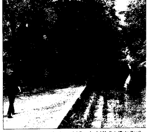
Monia Savioli Le panchine installate al ponte delle lavandaie e, a destra, la zona lughese del Canale dei Mulini.